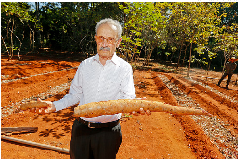
O cientista Nagib Nassar

Ele diz que o dinheiro será doado à UnB (Universidade de Brasília), na qual